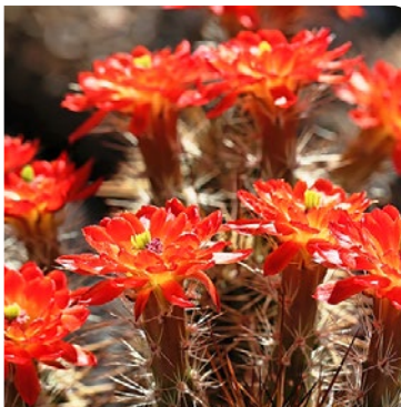
Ein Feuerwerk an Farben.