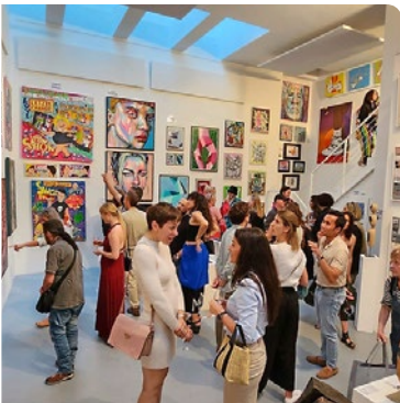
Über 30 Künstler zeigen ihre Arbeit.

United Art Zürich Deluxe 2024 Die Joss Toledo Art Gallery präsentiert vom 15. bis 19. Mai das United Art Zürich Deluxe 2024. Über 30 internationale Künstler*innen mit faszinierenden Kunstwerken verwandeln die Galerie Art & Business in der Zürcher Altstadt in eine barocke Kathedrale der Kunst. Eintritt frei. Datum: 15. bis 19. Mai; Mi. von 17 bis 21 Uhr, Do./Fr. 15–21 Uhr, Sa. 12–21 Uhr, So. 12–16.30 Uhr Ort: Trittligasse 4, 8001 Zürich