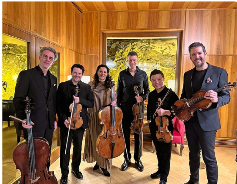
Die Musikerinnen und Musiker von Stradivari spielen in Zürich.

Während einer ganzen Saison vertiefen sich die Stradivari-Musikerinnen und Musiker in Antonín Dvořáks Kammermusikschaffen. Das StradivariFEST im Florhof (MKZ) und im Kaufleuten bilden das sechste und siebte Konzert der «Klangwelle Zürichsee – Dvořák». Das dort gespielte berühmte amerikanische Streichquintett und -quartett entstanden im Sommer 1893 während Dvořáks Familienurlaub in Spillville, Iowa. Dieser bot dem Komponisten einen Rückzugsort voller Inspiration, umgeben von seinen Landsleuten aus seiner Heimat Südböhmen. Seine Kompositionen widerspiegeln das Flair der idyllisch amerikanischen Landschaft zusammen mit einem Gefühl des Aufbruchs und der Freiheit. Gleichzeitig ist Dvořáks unermüdlicher Wunsch zu spüren, der Entstehung eines authentischen amerikanischen Musikidioms mitzuwirken als Teil seines Amtes als Direktor und Professor für Komposition am New Yorker National Conservatory of Music. Er war überzeugt, dafür auf die Musik der afro-amerikanischen und indigenen Bevölkerung zurückgreifen zu müs-