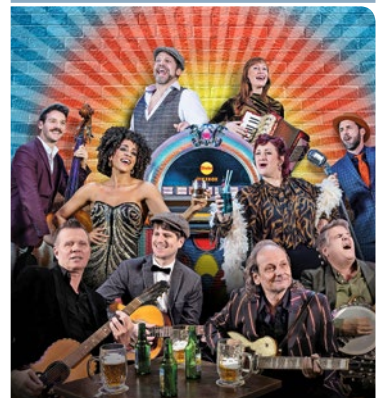
Der Jukebox-Heroes-Cast.

Jukebox Heroes Die ultimative Kneipen-Show mit Hits von ABBA bis Zucchero. Nach «Bye Bye Bar» und «Camping Camping» kommt endlich eine neue Shake-Musik-Show! Mitfeiern, verzaubern lassen und einen Abend voller Musik und